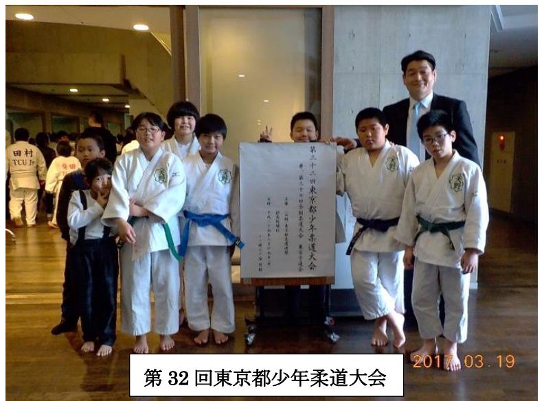
第 32 回東京都少年柔道大会

『有効』が廃止されました。『技有』の『合わせ技一本』も無くなり、より攻撃的な姿勢を意識させて一本勝ちによる決着を促すことが目的です。消極的な戦い方などに出される『指導』も、これまでは4度目で『反則負け』となっていたのですが3度に減らし、今まで以上に厳しくなりました。抑え込みの時間も『技有』15秒だったのに5秒短くなり10秒となりました。柔道の各大会によって少し異なる場合もありますが、普段の稽古から積極的に技を掛けていく練習をしていきましょう。(緒方光一)